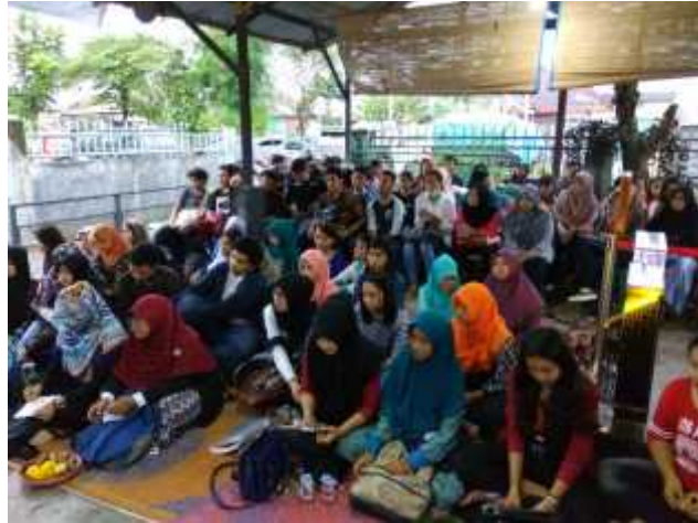
Gambar 1. Peserta Seminar Aktualisasi dan Filosofi Kepemimpinan Tradisi ini mengambil tema kepemimpinan tradisi Minang dan Mandailing